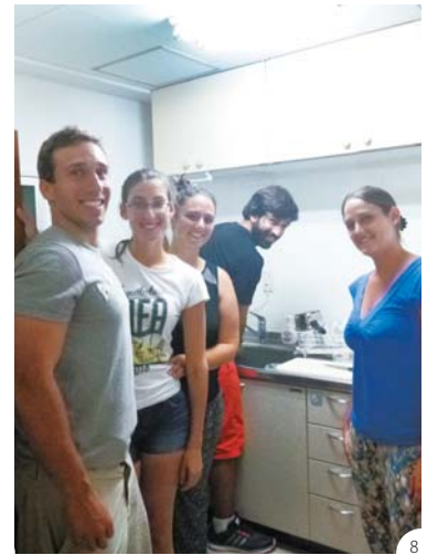
⑥地域の祭りへの参加など、日本文化に触れられる機会を提供 ⑦⑧大学や高校などからの団体利用も多く、ウルグアイから国費で送り出された若者たちも