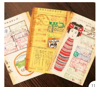
⑨日本の旅や宿泊所の相談にのることも多く、プランに合うユースホステルを紹介 ⑩受付には地方のユースホステルのパンフレットも設置 ⑪昔は全国のユースホステルで宿泊スタンプを集めていた人が多く、大切な思い出となっている(写真は坂田マネージャーの私物)