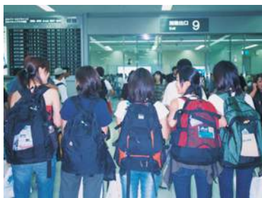
日本縦断旅行のひとつコマ

大学4年生の時、女友達4人と一緒に日本縦断に挑戦したんです。学生ですから当然、超の付く低予算企画。札幌をスタート地点にして、ユースホステルとJR青春18きっぷをフル活用しながら、日本海側を「南下」しました。太平洋側だと誘惑も多く、何かあったら挫折して、安易に東京に戻ってしまいそうなので。根拠はありませんが、スティックなイメージの日本海側を選びました(笑)。日本縦断中には各地のユースホステルを利用しましたよ。ただ、衣類も最小限のものしか持って行っていなかったので、洗濯物がおいつかなくなっ…ユースホステルはどこも洗濯機が使えるので、本当に助かりました。大部屋いっぱい洗濯物を干したり、キッチンを使わせてもらって自炊をしたり、施設をフル活用させてもらいました。そんな若さゆえの肝っ玉チャレンジでしたが、新潟で花火大会を見物したり、京都では天橋立YHでくつろいだりと、なかなかの充実っぷりで、ゴールに決めた屋久島に着いたときは、とても感動しました。