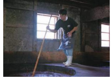
• Soy sauce • 醤油

真砂喜之助製麺所 香川県小豆郡小豆島町池田2484-2 TEL:0879-75-0373