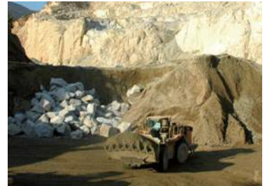
• Stone • 石材

かどや製油小豆島工場 香川県小豆郡土庄町甲6188 TEL:0879-62-1133