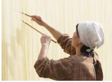
• Somen • 手延べそうめん