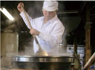
• Food boiled in soy sauce • 佃煮

ヤマロク醤油 香川県小豆郡小豆島町安田甲1607 TEL:0879-82-0666