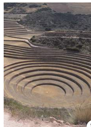
② 間近に見たマラスの塩田。なお、塩田が白くなるのは乾季である4～9月 ③ 聖なる谷にも、先住民たちが、連れているのはアルパカ ④ 大きなものだとして直径100mもあるモライ