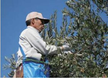
• Olive • オリーブ

「一回、島のを食べたら他のものは食べたいと思わないですね」。本場の地中海産より美味しいと言われるのは、すべてを手摘みで収穫する農家さんの努力のおかげ。