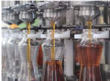
• Pure sesame oil • 純正ごま油

小豆島食品 香川県小豆郡小豆島町草壁本町 491-1 TEL:0879-82-0627