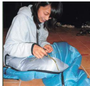
大学の夏休みを利用して参加した、フランスのボランティアキャンプでのスナップ。

もつながっている気がします。だから私にとっての旅は、気分転換やストレス発散という意味合いだけではなく、生きていく上での自信を育んでくれて、「生きていくチカラ」を充電するための時間。大切な感覚や本能を呼び覚ましてくれるかけがえのないものです。