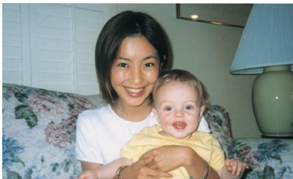
学生時代、ホームステイ先での記念写真。

最近、私の旅にける情熱も周囲に大分理解・浸透してきて、周りにハラハラされることも減りましたが、それでも生後数ヶ月から娘を連れて、どんどん海外に出かけて行くのには、皆さん驚かれますね。“いかに子どもをうまくあやして人様にご迷惑をおかけしないか”というも旅の重要なテーマで、飛行機に乗るときも各種あやし系グッズを完全装備して臨みます。それを当日まで見せずにおいて、機内でぐずりそうな気配がしてきた時にサッと取り出すんです。他にも子どもの生活リズムに合わせて長距離のフライトでは夜便を選んだり、いろいろ対策を練ってから旅に出るので、これまで一度も娘を大