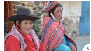
④サクサイワマンという高台の遺跡からは、クスコ市街が一望できる ⑤アルマス広場の中心に立つ、インカの第9代皇帝パチャクティの像 ⑥鮮やかな民族衣装に身を包んだ先住民。皆、誇り高さインカの末裔だ