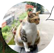
猫の町で待ってるニャー