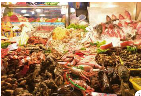
④夜になると赤い提灯がともる九份。レトロなムード全開! ⑤「猫の町」で見かけた、麵料理の店の看板 ⑥「台湾のナイアガラ」と十分瀑布へは、30分ほどハイキング ⑦豪華な海の幸が並ぶ基隆の夜市