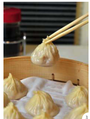
①台北でも最も有名な龍山寺。境内はいつも地元の人でいっぱい! ②かわいい雑貨探したら、永康街へ。最新の雑貨屋さんが集まっている ③小籠包は、箸でつまむときれいな釣鐘型になる