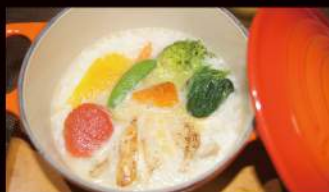
スチームリゾット ¥1,000