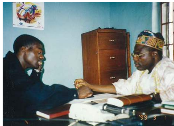
貿易業を営む父親(右)の事務所で。ここで6歳の頃から、經理の手伝いをはじめ、仕事や生き方に対して、厳しくしつけられた。ボビーさんにとって、いわば“第二の学校”。

それ聞く?(笑)いやあ、若気の至り?ってやつ。お父さんから、日本での買い付けとかのためになって、大金渡されて。で、ある人に言われたわけ。「この“パチンコ”というゲームは、すぐにお金が2倍、3倍になるよ」って。んなわけないって今なら分かるけど、20年くらい前のオレは、信じやすかったんだね。アフリカからのおのぼりさん(笑)。で「いいこと教わった!」と思って、アパートもパチンコ屋さんのすぐそばにしたの。「お父さんのお金を倍にしよう!」って。結果はみんな分かる通り。ぜーんぶパー。目の前まっくらなんてもんじゃないよ!(笑)。当然、ナイジェリアに帰れるわけもなく。ヤバすぎるでしょ?うわーっ、どーすんだよって(笑)。