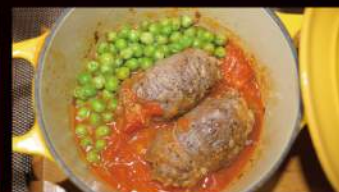
国産牛のブラジオリ ¥1,500