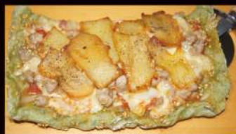
フティーラピッツァ ¥1,000