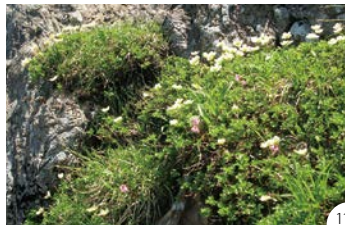
⑨「琴畑(コトハタ) 溪流」 ⑩「遠野盆地の雲海」⑪「早池峰山」は、高山植物マニアにとって、憧れの山。ベストは花の季節の7月だが、秋の紅葉もおすすめ。東北の紅葉は、9~10月とかなり早いので要注意。