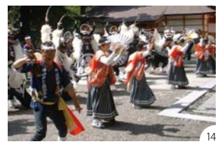
⑫⑬⑭9月中旬に開催される遠野まつり、正式名称「日本のふるさと遠野まつり」は、遠野市最大のイベントとして市内全域が盛り上がりを見せる。また、祭中に奉納される、勇壮な南部流籠馬(やぶさめ)も必見。同じ時期に、秋の遠野風の丘市や遠野郷八幡宮の神輿渡御、遠野南部七福神例祭も行われ、秋の遠野はお祭り一色の華やぎと賑わいを見せてくれる。