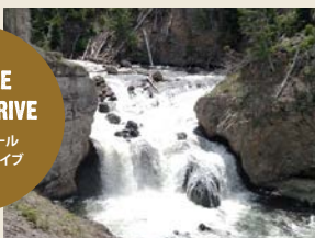
FIREHOLE CANYON DRIVE ファイアーホール キャニオンドライブ

ガイドブックに、野生の動物がたくさんと書いてある所でしたが、昼間だったので、期待しないで南側のエリアへの移動の通過点として通りました。想像以上の景色の美しさに驚いていると、目に入って来たのは、たくさんのバイソン!しっぽをフリフリ草を食べている姿が見られました。イエローストーンに行ったら、是非!と思う場所です。