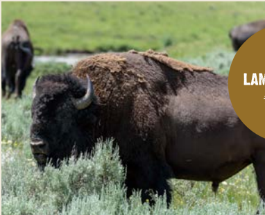
LAMAR VALLEY ラマーバレー