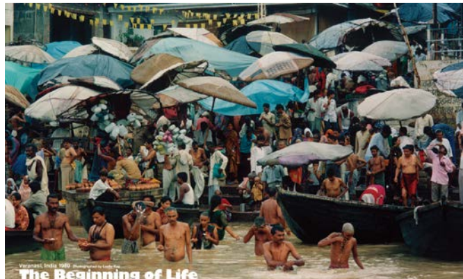
1989年、18歳のときに初めてバックパッカーとして旅をしたインド・VARANASIでの一枚。この写真が、自分の人生を変えた。