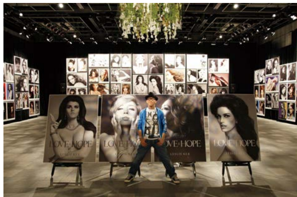
2011年、東北地震と津波の被災者へのチャリティを目的として、TIFFANYとのコラボレーションで発売した、世界中の美しい女性達を200人集めた写真集「LOVE&HOPE」の写真展で。

“Life is a gamble!”だよ。人生は、「賭ける」もの。自分を縛って壁をつくってしまうのは、もったいない。私は、みんなが興味のないものを拾って、それを何かに使おうとするタイプ。だって、誰からもやっちゃダメとは言われていないし、やったほうが良いとも言われていないことなら、自分次第で自由にできるでしょう?