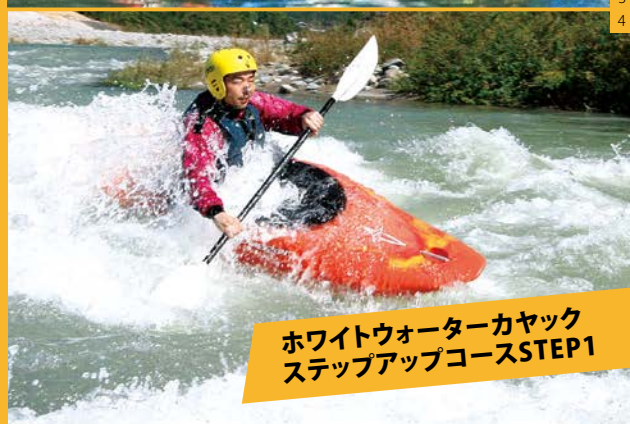
ホワイトウォーターカヤック ステップアップコースSTEP1