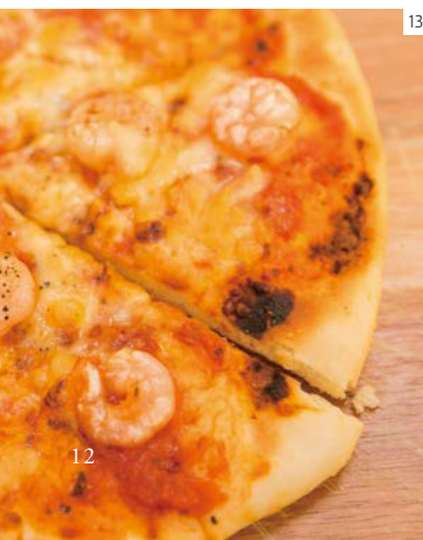
⑬ ⑭⑮夕食は併設のカフェ「ハーベステラス」で食べることができる。本格派のピザとカレーが定番メニュー。10名以上の団体の宿泊客には定食の提供もしている。