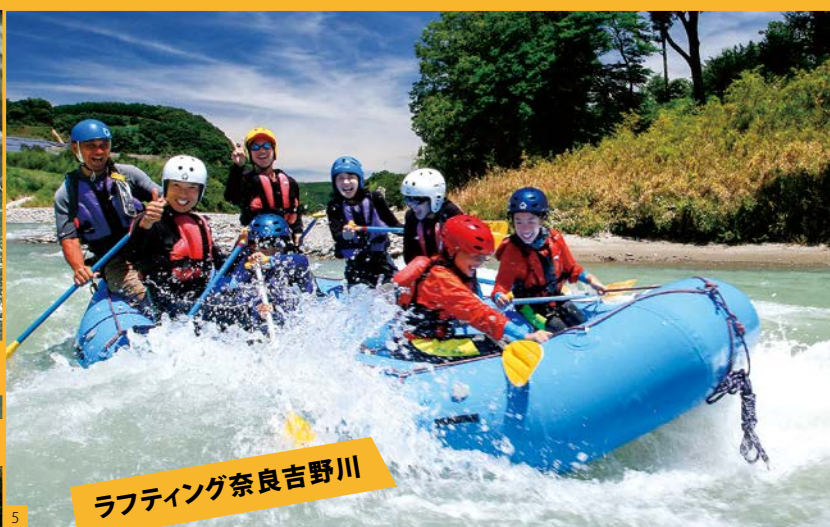
ラフティング奈良吉野川