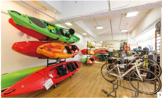
⑨カヤックを多数展示したカヤック売場はモンベル五條コース hostel ならでは。カヤック商品の品揃えはモンベルストアの中でもトップレベルだそうです。