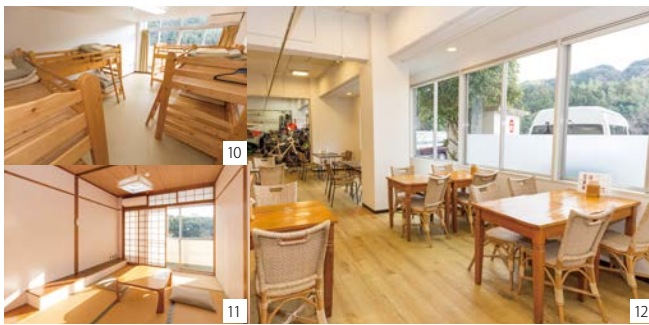
⑩中高生の合宿利用が多い洋室(8名用)。⑪5名用の和室10畳、2~3名用の和室6畳の他に、6名グループと一緒に泊まれる和室6畳2室の続き部屋もある。