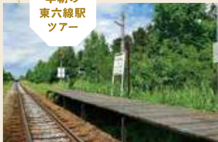
早朝の 東六線駅 ツアー

JR宗谷本線の東六線駅は、鉄道ファンの間ではよく知られる秘境駅。このツアーは、東六線駅で10分降り立ち、塩狩ヒュッテユースホステルでの朝食までに戻ることができるプラン。そこから見える風景は、鉄道ファンはもちろん、すべての方にオススメです。