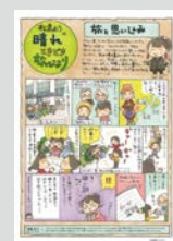
松島むうの晴れときどき旅びより ..... P21