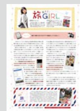
教えて! 旅GIRL ..... P20