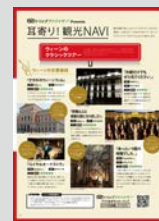
トリップアドバイザー Presents ..... P18 耳寄り! 観光NAVI ウィーンのクラシックツアー ■ ウィーンの交響楽団 ■ ウィーンの庭園