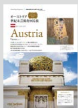
Hostelling Magazine x 地球の歩き方... P12 オーストリア世紀末芸術を回る旅 ■ ウィーンの美術館巡り ■ チェコ&スロヴァキアへのショートトリップ