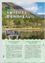
Youth Hostel Pick up ..... P08 大自然を旅する冒険物語の主人公に 駒ヶ根ユースホステル