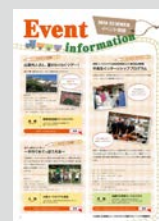
Event Information ..... P22