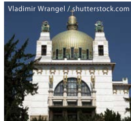
ワグナーの設計したシュタインホーフ教会

ウィーン分離派のひとりであるデザイナー。ワグナーとの関わりが深く、シュタインホーフ教会の祭壇やモザイク画、ステンドグラスなどは彼の作品。ほかの3人に比べ日本では知名度が低い。インテリアデザインのほか絵画、家具、ポスターなどの分野でも活躍した、多才な人物。