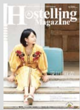
HostellingMagazine vol.13 まとめてダウンロード