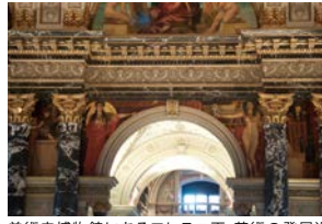
美術史博物館にあるフレスコ画。芸術の発展過程をテーマとしている

ウィーン郊外のバウムガルテンに生まれた、世紀末芸術を代表する画家。芸術界ではそれまでタブーとされてきた「エロス」や「死」など、人間の内向的なものをテーマとした作品を多く残した。『パラス・アテネ』や『接吻』といった金箔を多用したきらびやかな作品は、クリムトの真骨頂。絵画のほかフレスコ画も多く手がけた。フレスコ画の代表作は、セセッションにある3枚の壁画からなる連作『ペーターベンフリース』。