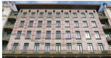
イタリアのマジョリカ産のタイルで飾られたマジョリカハウス