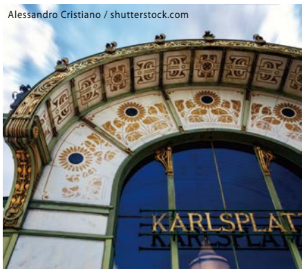
カールスプラッツ駅。ウィーン市営地下鉄施設のひとつ