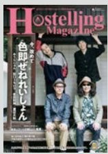
Hostelling Magazine vol.17 まとめてダウンロード