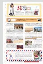
教えて! 旅GIRL ..... P22