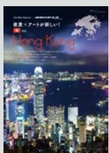
Hostelling Magazine × 地球の歩き方... P16 夜景×アートが新しい! 香港 ■ 町中が美術館! 中環〜上環ウォールアート巡り ■ SNS映え必至! かわいいスイーツ店が急増中 ■ 今、リノベスポットがアツい! 2大最新スポット案内 ■ 2泊3日で満喫する香港観光モデルルート

発行所: 一般財団法人日本ユースホステル協会 編集・発行人 寺島眞 〒151-0052 東京都渋谷区代々木神園町3-1 国立オリンピック記念青少年総合センター内 印刷・製本: サンメッセ株式会社 ※本誌の情報は2019年6月20日現在のものです。 変更になる場合がありますので、お出かけになる前に現地にお確かめください。 ※本誌掲載記事の無断転載を禁じます。