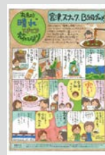
松島むうの晴れときどき旅びより ..... P23