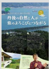
Youth Hostel Pick up ..... P12 海と空を結ぶ、緑の架け橋 丹後の自然と人が旅のよこびにつながる 天橋立ユースホステル