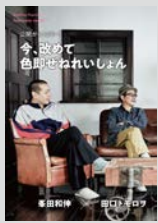
インタビュー ..... P02 原作/みうらじゅん 監督/田口トモロヲ 銀杏BOYZ/峯田和伸 黒猫チエルシー/渡辺大知 今、改めて色即せねれいしょん