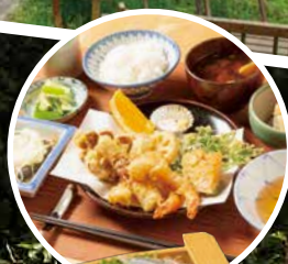
+980円の夕食は「朝獲れ刺身5種盛り合わせ」1,500円(2~3人前)の追加も可能(要予約)。鮮度抜群の旬魚は絶品!