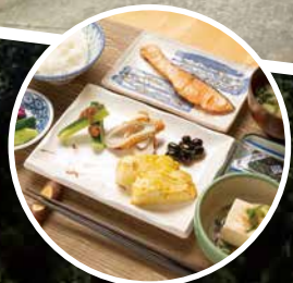
宿泊費+620円で朝食付き。