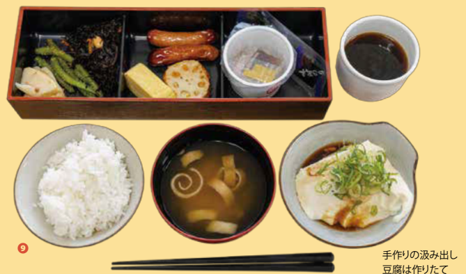
手作りの汲み出し豆腐は作りたて