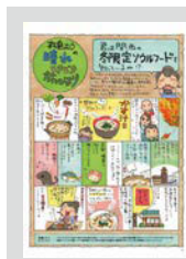
松島むうの晴れときどき旅びより ..... P21