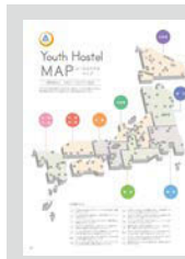
Youth Hostel MAP ..... P22