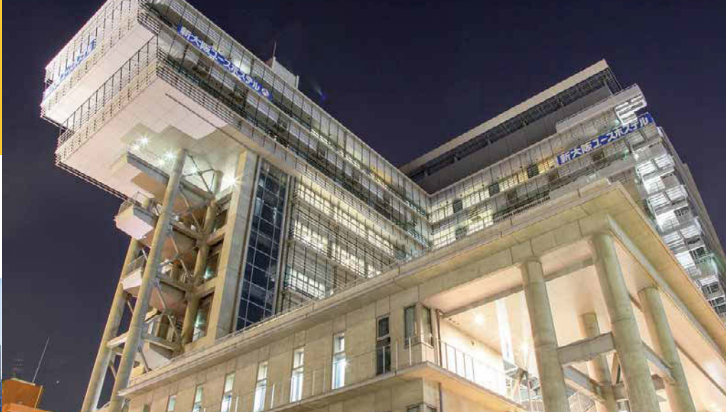
一部の部屋や10階の食堂からは、大阪梅田の景色が一望。夏には大阪淀川花火大会も楽しめる。