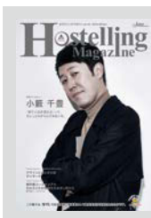
Hostelling Magazine vol.19 まとめてダウンロード