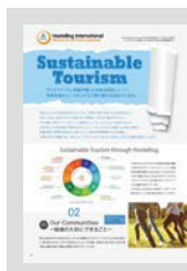
Sustainable Tourism ..... P18