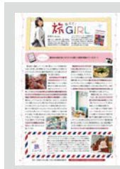
教えて! 旅GIRL ..... P20