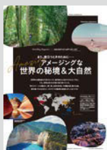
Hostelling Magazine × 地球の歩き方... P12 また、旅立つための…… アメージングな世界の秘境 & 大自然