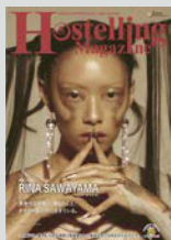
Hostelling Magazine vol.21 まとめてダウンロード