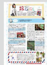
教えて! 旅GIRL ..... P21