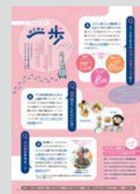
ユースホステルはじめての一步 ..... P20