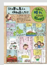
松島むうの晴れときどき旅びより ..... P22