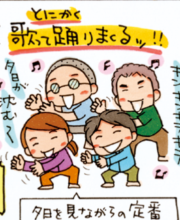
夕日を見ながらの定番