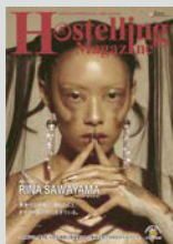
Hostelling Magazine vol.21 まとめてダウンロード