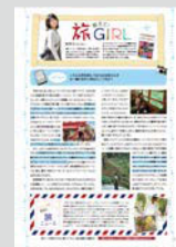
教えて! 旅GIRL ..... P21