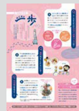
ユースホステルはじめての一步 ..... P20