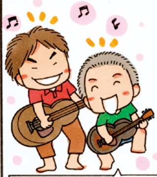
桃岩荘メンバーにギターを教わる少年