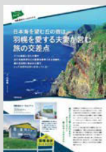
Youth Hostel Pick up ..... P08 日本海を望む丘の宿は、 羽幌を愛する夫妻が営む 旅の交差点 羽幌遊歩ユースホステル