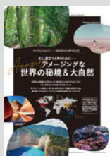
Hostelling Magazine × 地球の歩き方... P12 また、旅立つときのために…… アメージングな世界の秘境 & 大自然