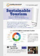
Sustainable Tourism ..... P18