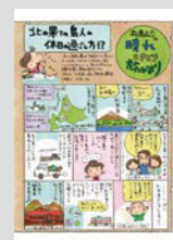
松島むうの晴れときどき旅びより ..... P22