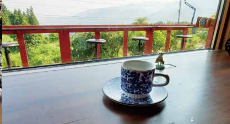
1. 2002年から作り始めた本格的な鉄道模型ジオラマ。サウンドシステムなどのこだわりもあり、子供はもちろん大人まで夢中になってしまう仕掛けだ。 2. カウンターに座り、雄大な景色を見ながらこだわりのコーヒーを飲む。時間を忘れさせてくれる贅沢な時間。