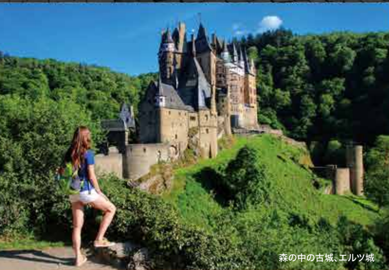
森の中の古城、エルツ城