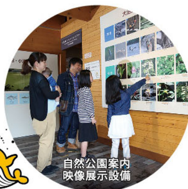
自然公園案内 映像展示設備