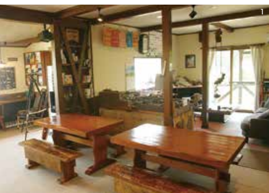
1. 広く取られたラウンジ兼ダイニング。鉄道模型のジオラマ以外にも様々なジャンルの書籍が揃い居心地の良い空間だ。 2.3. 部屋は和洋様々なタイプが用意されている。中にはロフト付きの部屋も。全室床暖房が完備されているので冬でも快適に過ごせる。