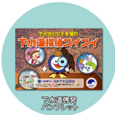
下水道啓発 パンフレット