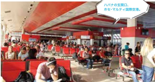
ハバナの玄関口、 ホセ・マルティ国際空港。

する21世紀の世界のよう。1日中いても飽きないほど魅力的なスポットが点在し、こんな世界があるのかと衝撃を受けました。