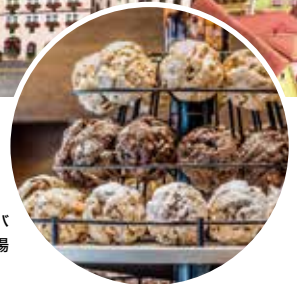
街の名物スイーツ、シュネーバール。ひも状の生地を丸め、油で揚げたドーナツのようなもの