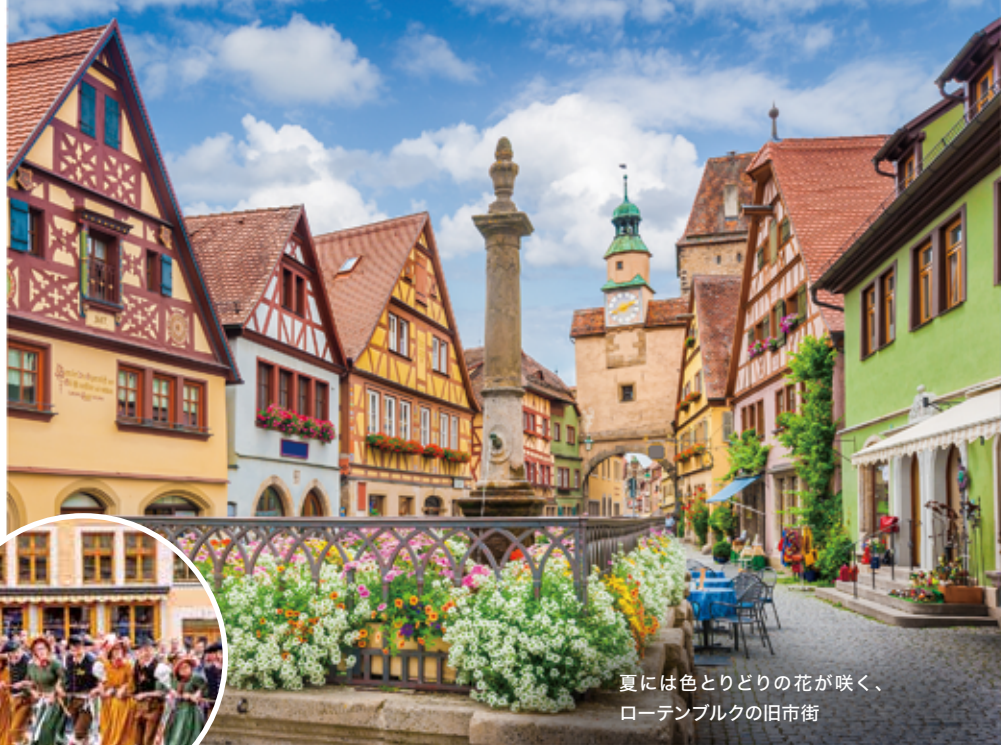
夏には色とりどりの花が咲く、ローテンブルクの旧市街