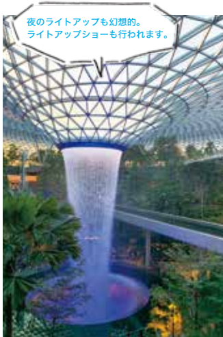
夜のライトアップも幻想的。 ライトアップショーも行われます。

空港という場所は、なぜこんなにワクワクするのでしょうか。とくに「世界の最も素晴らしい空港」ランキングで8年間トップに君臨するシンガポールのチャンギ国際空港に2019年にオープンした施設「Jewel」は、巨大なガラスドームの中に約2万2,000平方メートルものシンガポール最大級の屋内庭園や建物の中心に流れる高さ40メートルの滝など、スケールの大きさとアイデアに驚きます。まるで子どものころに見たアニメ「ドラえもん」に登場