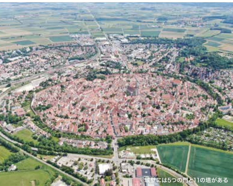
城壁には5つの門と11の塔がある