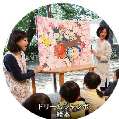
ドリームジャンボ 絵本