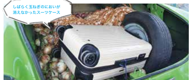
しばらく玉ねぎのにおいが 消えなかったスーツケース

「ガタン」という音とともにターンテーブルが回りだすと、拍手喝采！荷物を待ちわびていた旅人がハイタッチをして喜び合う…そんな光景がこの空港では日々繰り広げられているのです。ようやく荷物が出てきたのは、ハバナに到着してから3時間後。こんなに荷物が出てきうれしかったことは後にも先にもありません。（つぎにキューバに行く機会があれば、絶対預け荷物はしないと心に誓いました。笑）