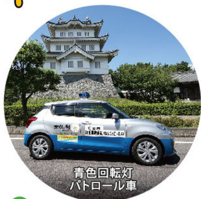
青色回転灯 パトロール車