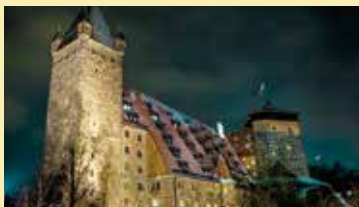
中世の要塞に泊まれる！Nürnbergのユースホステル