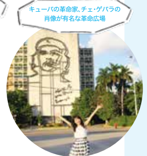
キューバの革命家、チェ・ゲバラの 肖像が有名な革命広場