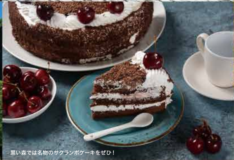
黒い森では名物のサクランボケーキをぜひ!