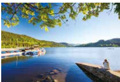
湖にはたくさんのボートが停泊する