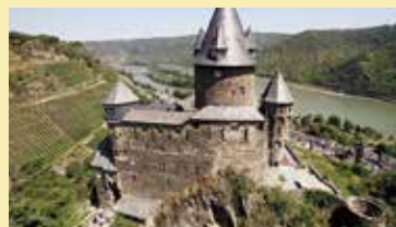
ライン川を見下ろす古城、シュターレック城のユースホステル、Bacharach