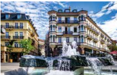
アウトドアのあとはバーデン・バーデンの温泉でのんびり