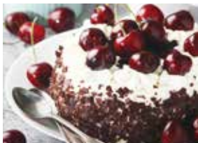
見た目よりは甘さは控えめ

黒い森地方の伝統的なケーキ。チョコレート味のスポンジ生地に、名産であるサクランボの蒸留酒(キルシュ)をたっぷりと染み込ませてある。ホイップクリームと削ったチョコレート、サクランボでデコレートするのが定番。