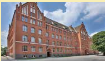
歴史ある学校をリノベーションしたベルリンのJugendherberge Berlin Ostkreuz