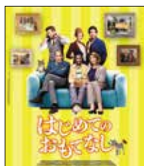
デジタル配信/ブルーレイ&DVD発売中 ブルーレイ: ¥5,170(税込) DVD: ¥4,180(税込) 発売・販売元: ポニーキャニオン

ミュンヘンの閑静な住宅地に暮らすハートマン家のディナーの席で、母アンゲリカは難民の受け入れを宣言。教師を引退して生き甲斐を見失った彼女は、夫リヒルトの反対を押し切って、ナイジェリアから来た難民の青年ディアロを自宅に住ませる。家族は、はじめてのおもてなしに張り切るが、大騒動が起きてしまう。さらに、ディアロの亡命申請も却下に。果たして、崩壊寸前の家族と天涯孤独の青年は、平和な明日を手に入れることができるのか?