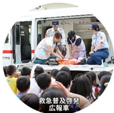
救急普及啓発 広報車

図書館や動物園、学校や公園の整備をはじめ、少子高齢化対策や災害に強い街づくりまで、さまざまなかたちでみなさまの豊かな暮らしに役立っています。