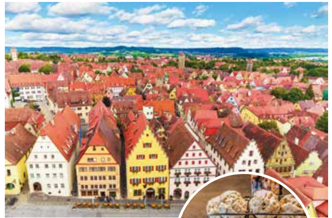
市庁舎から旧市街を望む

拠点はミュンヘンまたはフランクフルト。ローテンブルクまではどちらの町からも鉄道で約2時間30分。途中2、3回乗り換える。