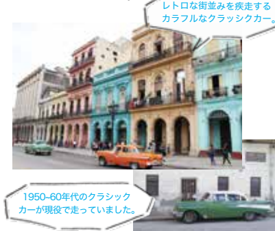
レトロな街並みを疾走する カラフルなクラシックカー。

疲れ果てて、宿泊先へ向かうためにタクシーに乗ると、なぜか後部座席にもトランクにも溢れんばかりの玉ねぎが積まれており、玉ねぎに囲まれての移動。信じられないことが次々と起こるキューバの洗礼を受けました。クラシックカーが走る古き良き街並みや美しいビーチ、陽気な人々…。訪れるまでは大変でしたが、それも含めた“キューバラしさ”を存分に味わうことができました。