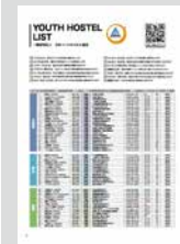
YOUTH HOSTEL LIST …………… P22