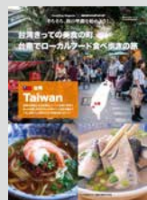
Hostelling Magazine x 地球の歩き方 … P12