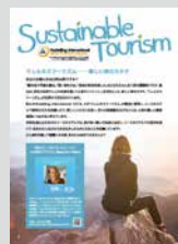
Sustainable Tourism …………… P16

発行所：一般財団法人日本ユースホステル協会 編集・発行人 寺島眞 〒151-0052 東京都渋谷区代々木神園町3-1 国立オリンピック記念青少年総合センター内 ※本誌の情報は2022年2月20日現在のものです。 変更になる場合がありますので、お出かけの前に現地にお確かめください。 ※本誌掲載記事の無断転載を禁じます。