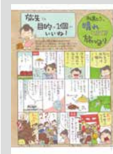
松島むうの晴れときどき旅びより …… P20