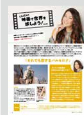
LiLiCoの映画で世界を旅しよう！…… P18