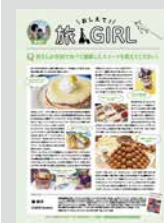
おしえて！旅GIRL …………… P19