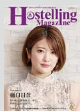
Hostelling Magazine vol.28 まとめてダウンロード