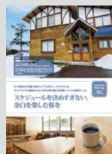
Youth Hostel Pick up …………… P08