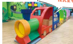
駅にはキッズスペースや授乳室も

乗り物が大好きな息子が大興奮だったのは、台湾新幹線の旅。往復運賃よりもお得な3日間乗り放題パスを使い、高雄から台南、台中、台北をめぐりました。