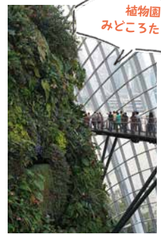
植物園はみどころたっぷり

シンガポールは、建国当初から、緑あふれる魅力的な都市づくりを目指す「Garden City」政策に取り組んでおり、緑の多さにも驚きます。とくに息子がお気に入りだったのは、マリナベイに広がるCGのような建造物で知られる「ガーデンス・バイ・ザ・ベイ」。東京ドーム21個分の広さを誇る巨大植物園は、入場料無料でありながら、遊具や水遊びエリアなど子どもが遊べる施設が充実。2日連続で訪れるほど、満喫しました。