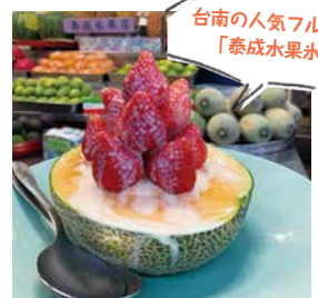
台南の人気フルーツ店「泰成水果水店」

親は台湾グルメを堪能し、息子は大好きな新幹線に3日連続乗ることができ、大満足! 成田から台北まで3時間50分という短いフライト、1時間の時差、冬でも温暖な気候。小籠包やチャーハン、ラーメンと子どもが喜ぶ食事もあるっており、台湾は子連れ旅に好条件の国なのです。