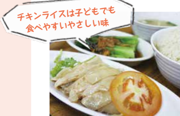
チキンライスが子どもでも食べやすいやさしい味