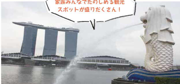
家族みんなでたのしめる観光スポットが盛りだくさん!

日本をはじめ、各国の入国制限が緩和されつつあることから、「海外旅行を検討している」という声も耳にするようになってきました。私の夢は、子どもと一緒に世界一周旅行をすること。また以前のように自由に海外旅行に行ける日が来るのを指折り数えているのですが、子どもと一緒に旅行はたのしい反面、移動がネックに。とくに、小さな子どもを連れての飛行機は、何度経験してもドキドキするものです。私が気を付けているのは、お昼寝の時間や深夜便など、いかに子どもが寝る時間に移動できるかということ。そして、機内でぐっすり寝てもらうために、公園でたっぷり体を動かしてから空港に向かい、搭乗ゲート前のキッズスペースでたくさんあそぶ作戦を遂行していました(笑)。