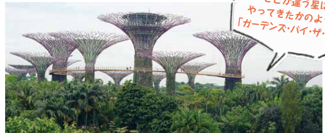
どこか違う星にやってきたかのような「ガーデンス・バイ・ザ・ベイ」

独身時代に訪れたときは気づかなかったのですが、シンガポールはバリアフリー化が進んでおり、道が整備されているのと、至るところにスロープがあるので、ベビーカーの移動でも、段差に困ることが1度もありませんでした。そして比較的コンパクトなサイズ感のおかげで、どこに行くにも近く、移動が苦になりません。