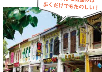
カラフルな街並みは歩くだけでもたのしい!