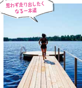
思わず走り出したくなる一本道

そして、サウナを出た後は湖へとつながる一本橋を渡って湖へダイブ! 思わず走り出したくなる爽快感あふれる天然の水風呂と素晴らしいロケーションでの外気浴に「あ〜フィンランドでサウナを満喫しているなあ」としあわせに包まれていました。