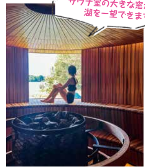
サウナ室の大きな窓からは湖を一望できます

湖畔沿いに建てられたモダンな建物の中に入ると「ここがサウナ?」と驚くほどの美しさ。石のゴツゴツした雰囲気や木の滑らかさなど、できるだけシンプルに自然に近づくことをコンセプトにしているといます。サウナ室の大きな窓からは湖を眺めることができ、天井まで続く木製のサウナベンチが自然の温かみを演出。