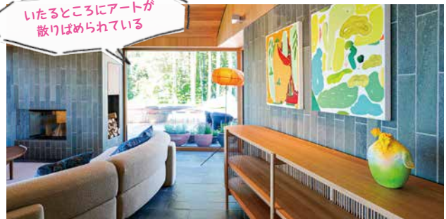
いたるところにアートが散りばめられている

湖畔沿いに建てられたモダンな建物の中に入ると「ここがサウナ?」と驚くほどの美しさ。石のゴツゴツした雰囲気や木の滑らかさなど、できるだけシンプルに自然に近づくことをコンセプトにしているといます。サウナ室の大きな窓からは湖を眺めることができ、天井まで続く木製のサウナベンチが自然の温かみを演出。