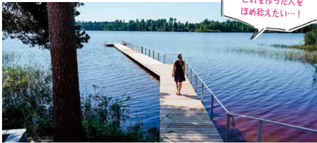
これを作った人をほめ称えたい…!

昔ながらの公衆サウナから最新のオシャレサウナまで5か所のサウナを訪れたのですが、特に気に入ったのは、フィンランド第二の都市・タンペレから車で1時間ほどの場所にあるセルラキウス美術館の敷地内に6月にオープンしたばかりの「アートサウナ」。