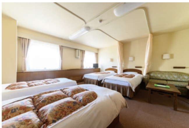
3名～5名用のお部屋は家族での利用にも。シングルやツイン、和室のお部屋もあって使い方の幅が広がる。