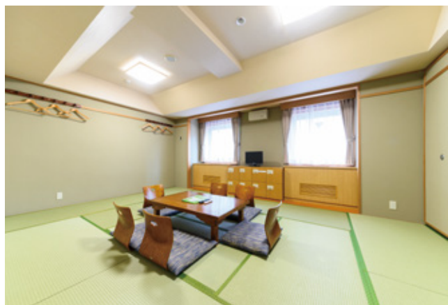
人気の和室は8畳と12畳の2タイプ。 小さいお子様連れのご家族や外国人観光客にも好評だ。