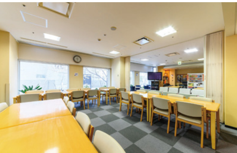
食堂やラウンジといった共有スペースは憩いの場。 泊まり合わせたゲスト同士が談笑する光景も珍しくない。

新卒で入った旅行会社で待っていたのは、平日は営業、土日は添乗という多忙な日々。多くの旅に携わるうちに、当時人気の「高級ホテルに泊まって名所を駆け足で巡る」という旅行の在り方に違和感を抱くようになった。そんな折、JICAの海外協力隊に応募した。「世界遺産・アンコールワットの観光開発を進めるために、内戦が終結したばかりのカンボジアで勤務しました。現地の人々と同じ目線で語り合い、人間関係を築きながら、インバウンド旅行客誘致のための取り組みを進めました。そして、講座を開設してプログラムをつくり、現地の人々を日本語ガイドとして養成。ハードな2年間でしたが、貴重な経験ができました」。