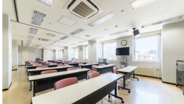
近くには会議室や体育館のある施設も。 観光だけでなく研修や合宿にも便利なユースホテルだ。