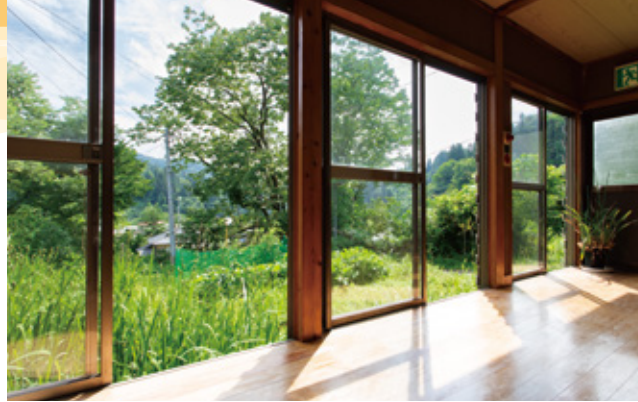
日当たりのいい縁側からは、四季折々の小千谷の風景を眺めることができる。