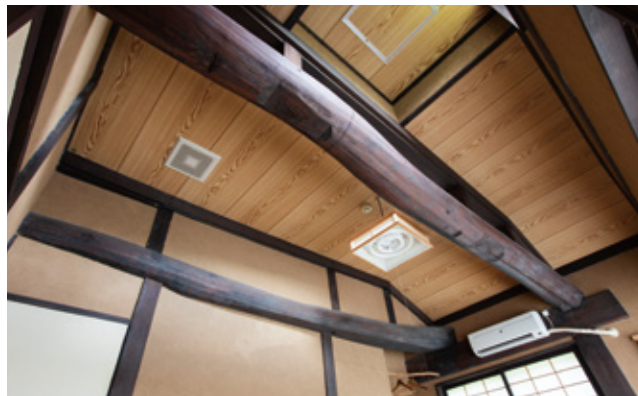
客室の天井には100年以上もこの家を守り続けている立派な梁が。