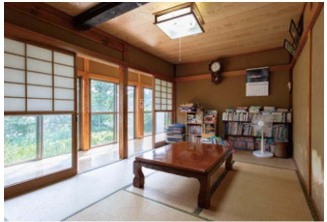
どこか懐かしい雰囲気のある談話室は、ゲストたちの憩いの場。