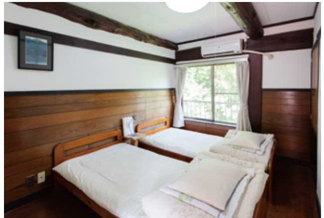
早めの予約でグループや家族で一室利用できるのも嬉しい。(※一室利用は要問い合わせ)