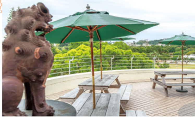
奥武山公園を見下ろすテラスでは、バーベキューを楽しむことも。