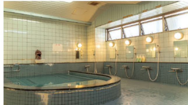
アクティブな旅を楽しんだ後は、大浴場でリフレッシュ！