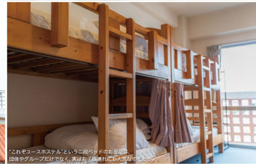
*これぞユースホステルという二段ベッドのお部屋は、団体やグループだけでなく、実はお子様連れにも人気なのだとか。