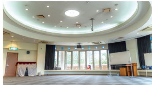
大小2つの研修室を備え、団体研修や修学旅行といった大型団体の利用も。