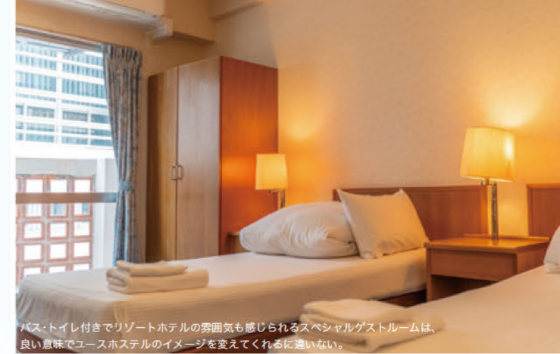
バス・トイレ付きでリゾートホテルの雰囲気も感じられるスペシャルゲストルームは、良い意味でユースホステルのイメージを変えてくれるに違いない。

〒900-0026 沖縄県那覇市奥武山51 電話: 098-857-0073 URL: http://www.oiyh.org/