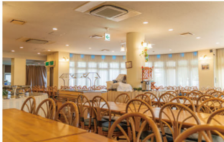
合宿などの利用も多い、エナジック沖縄国際ユースホステル。食堂にはボリュームだけでなく、栄養のバランスも考えられたメニューが並び。

ミトリータイプで構成されている。大浴場でのバスタイムや、お腹いっぱい食べられるバイキング形式の食事なども含め、団体に訪れる小中高生にとっては非日常体験だ。