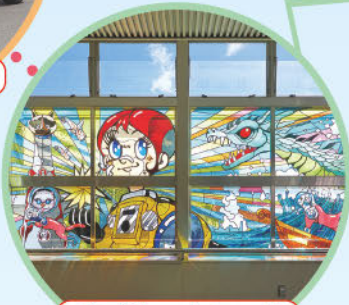
パブリックアート