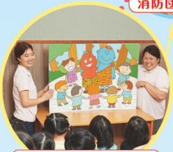
宝くじドリームジャンボ絵本