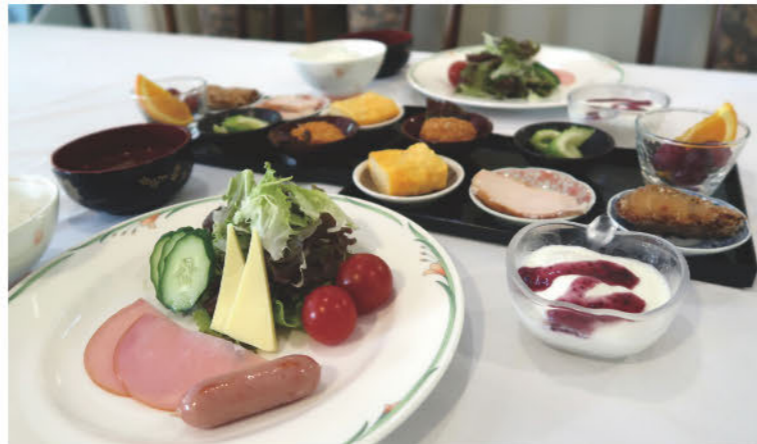
高原の朝を彩る朝食も、野菜がたっぷり使われたヘルシーなもの。「一度訪れるとリピーターになってしまう宿」。そう言われる所以は食事にあるのかもしれない。