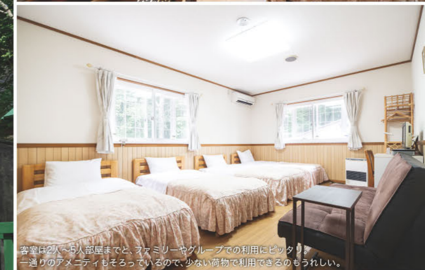
客室は2人〜5人部屋までと、ファミリーやグループでの利用にピッタリ。一通りのアメニティもそろっているので、少ない荷物で利用できるのもうれしい。