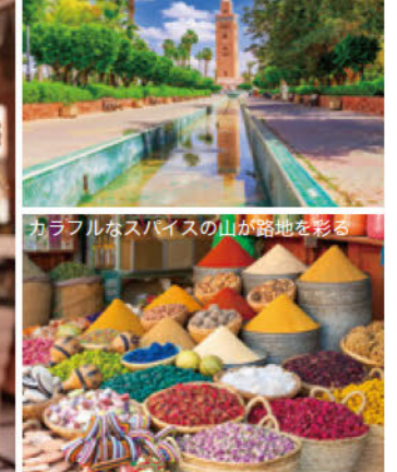
カラフルなスパイスの山が路地を彩る