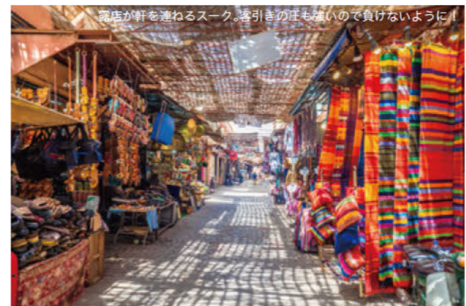
露店が軒を連ねるスーク。客引きの庄も無いので負けないように！

マラケシュの街は、新市街と旧市街、史跡地区の大きく3つに分かれている。観光の中心となるのは「メディナ」と呼ばれる旧市街と王宮や宮殿のある史跡地区で、周囲をぐるりと城壁に囲まれている。メディナの中心となるのがジャマ・エル・フナ広場。1日を通して人通りが絶えない活気あふれる広場だ。広場からは網目状に通りが延びており、無数のスーク(市)がひしめく。マラケシュでは、入り組んだ路地を当てもなく歩いてみるのがおすすめ。スークに並ぶ露店を眺めれば色とりどりの民芸品が次々と目に飛び込み、香辛料の香りが鼻腔を刺激する。メディナを歩き、喧噪と混沌、そして色彩あふれるモロッコの魅力を五感で感じ取りたい。