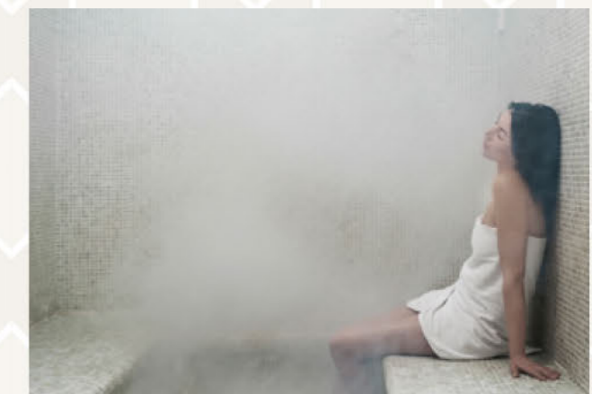
蒸気で汗をかき、癒やされる