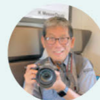
鉄道写真家 櫻井寛

1954年長野県生まれ。鉄道員を目指し昭和鉄道高校に入学したが、在学中に鉄道写真の魅力にとりつかれ写真家に転向、日本大学芸術学部写真学科卒。出版社写真部に15年間勤務。90年にフォトジャーナリストとして独立し、今日に至る。93年、航空機を使わず陸路・海路のみで88日間世界一周。94年『鉄道世界夢紀行』で交通図書賞受賞。旅した国は95カ国、渡航回数は250回超。写真集『列車で行こう! The Railway World』(世界文化社刊)など著書多数。日本写真家協会、日本旅行作家協会会員。東京交通短期大学客員教授。