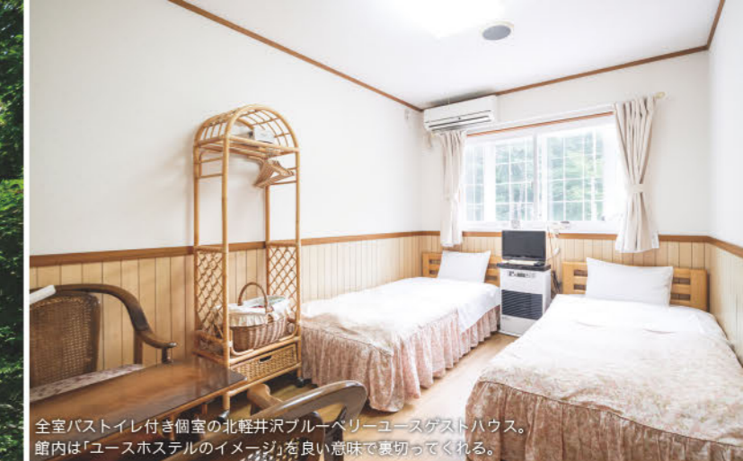
全室バストイレ付き個室の北軽井沢ブルーベリーユースゲストハウス。館内は「ユースホテルのイメージ」を良い意味で裏切ってくれる。