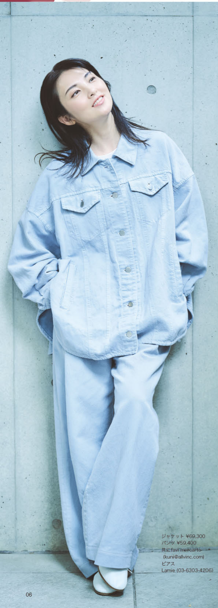
ジャケット ¥69,300 パンツ ¥59,400 共にfavi mercato (kuni@allvinc.com) ピアス Lamie (03-6303-4206)

るんですけど、私としてはテーマにこだわっているわけではなく、あくまで直感的に惹かれるものに挑戦している感じです。