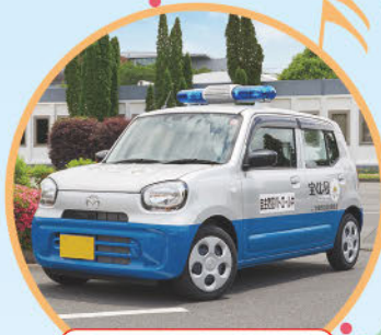
青色回転灯装備車

宝くじは、少子高齢化対策、災害対策、 公園整備、教育及び社会福祉施設の 建設改修などに使われています。