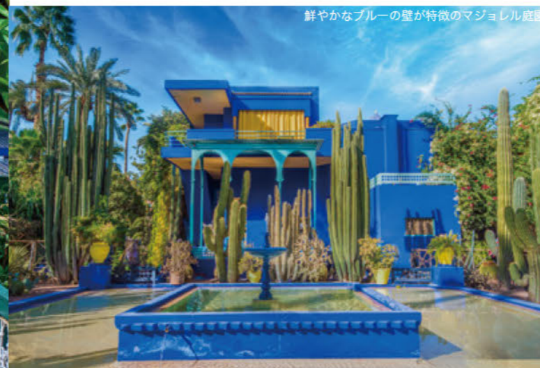
鮮やかなブルーの壁が特徴のマジョレル庭園

マラケシュを愛した世界的なファッションデザイナーといえば、イヴ・サンローラン。1966年にパートナーであるピエール・ベルジェとともにマラケシュを訪れ一目惚れし、メディナの中に住居を構えた。マラケシュに滞在しながら数々のデザインを生み出した彼は、1980年にマジョレル庭園を買い取り、2002年の引退後は多くの時間をそこで過ごした。死後、その遺灰は庭園内にまかれ、記念碑も立っている。