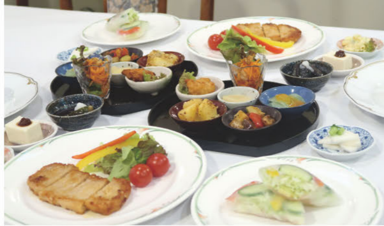
「食べる直前に精米する」というこだわりのお米と、嬌恋の高原野菜にマネージャーこだわりのメインディッシュが並ぶ夕食はボリューム満点。