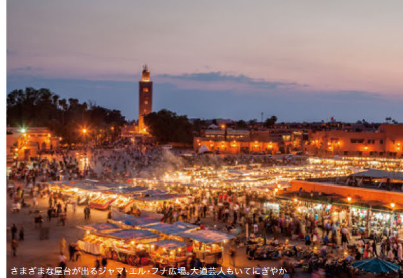
さまざまな屋台が出るジャマ・エル・フナ広場。大道芸人もいてにぎやか