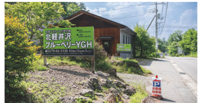
豪華すぎず、質素すぎない。心地よさと自由さのバランスが「ちょうどいい宿」が、北軽井沢にあった。