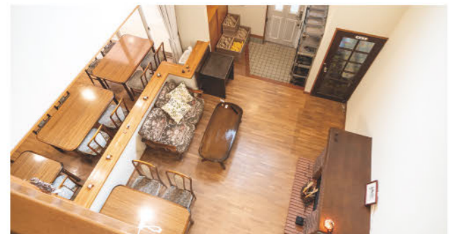
ユースホステルよりプライベートな空間が重視されたユースゲストハウスだが、ラウンジスペースはゲストが思い思いにくつぐ「ユースホステルらしい」風景になる。

「東京で知り合い結婚した妻も『いいんじゃない』と言ってくれて、全国各地の物件を探し始めました。そこから1カ月、たまたま見つかった中古のペンションがここだったんです。かつて旅先で知り合った人たちの応援もあって、あれよあれよという間にオープン。旅好きの人は旅の話が好きでしょう。宿のオーナーがそのネタをたくさん持っているから、そこが強みになりましたね(笑)。あとは口コミで多くの人を訪れるようになって、間もなく開業30年を迎えます」