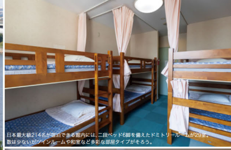
日本最大級214名が宿泊できる館内には、二段ベッド6脚を備えたドミトリールームが29室。数は少ないがツインルームや和室など多彩な部屋タイプがそろう。