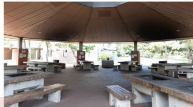
屋外ではバーベキューも楽しめる。宿泊客でなくても利用できるほか、食材や必要な機材一式がレンタルできるので手ぶらで楽しめる。