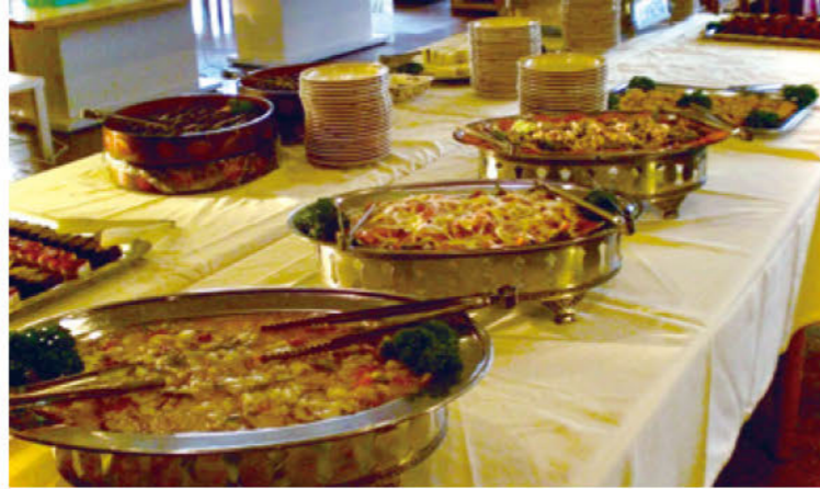
バイキングから会席・鍋料理まで、専属シェフが腕を振るう食事は人気が高い。事前予約制で、10名以上の団体利用からの受付となる点にご注意を。