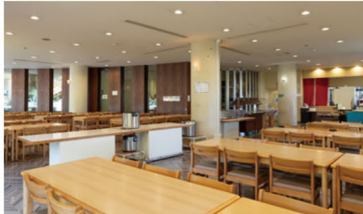
140席もある大型の食堂は、公園の緑を眺めながらゆったりと食事を楽しめる。夜間はフリースペースとして開放されるのもうれしい。