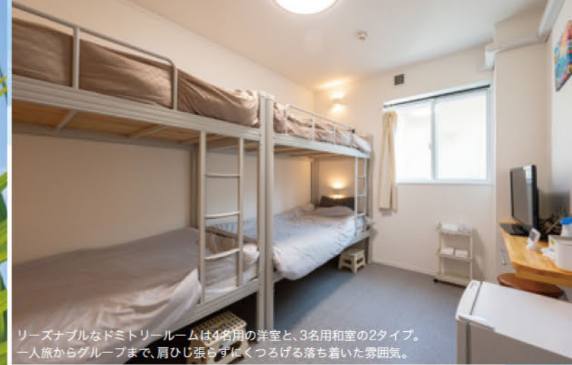
リーズナブルなドミトリールームは4名用の洋室と、3名用和室の2タイプ。一人旅からグループまで、肩ひじ張らずにくつろげる落ち着いた雰囲気。