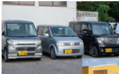
ユースホステルではレンタカーの貸出しも行なっている。詳細は予約時に確認を！

準備や工事に2年間をかけ、2025年4月に念願のオープンを果たしたユースホステルKikai。全館バリアフリーの平屋建てで、老若男女問わず快適に過ごせる。客室は個室とドミトリーの2種類で、最大18名を収容可能だ。個室は1名用が2部屋に、2名用が1部屋。2段ベッドを配したドミトリーは3名用と4名用が2部屋ずつ用意されている。特徴的なのは、シャワールームと別に設けられているサウナ。島内での観光やアクティビティを楽しんだ後は、ここでじっくり汗を流して「ととのう」ことができる。