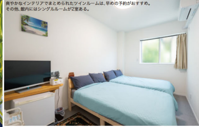
爽やかなインテリアでまとめられたツインルームは、早めの予約がおすすめ。その他、館内にはシングルルームが2室ある。