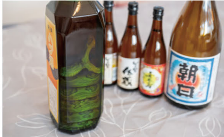
榮さんが「飲み放題」という地酒の中に奄美のハブ酒を発見！