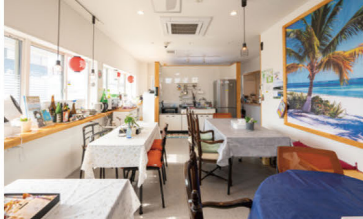
開放感たっぷりのダイニングルームは、各地から来たゲストで賑わう。食事の提供はないが、地元の食材をキッチンで調理すれば「憧れの島暮らし」気分を味わえる。